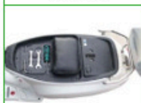
cargador y herramientas